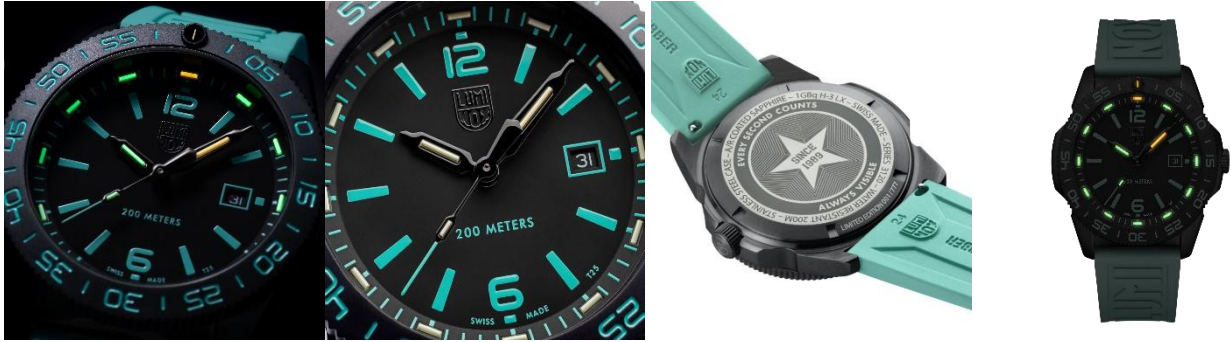
Ref. Luminox 3124.N.SET

「Pacific Diver 3120 Transformative Teal Edition」は、耐久性・視認性・現代的なデザイン性を高次元で融合させ、モダンスポーツウォッチの新たな在り方をさらに洗練したモデルです。その仕上がりは、水中でも日常でも自然に溶け込み、常に変化し続ける現代のライフスタイルに寄り添う一本となっています。