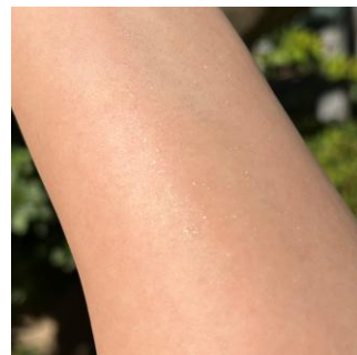
※ミンティーピーチの香り：塗布後のイメージ