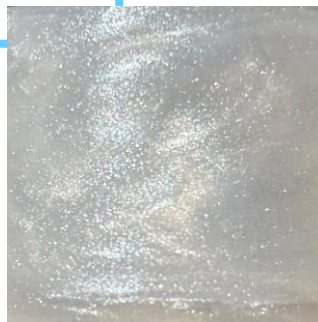
※ミンティーピーチの香り：ラメ(※1)のイメージ