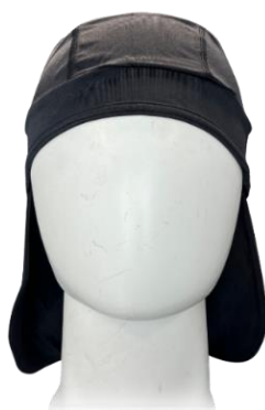
タレがついているので首の後も 涼しく快適に使用できます。