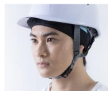
ヘルメットインナーとしてオススメ