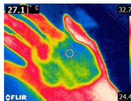
※塗布後の冷感イメージ