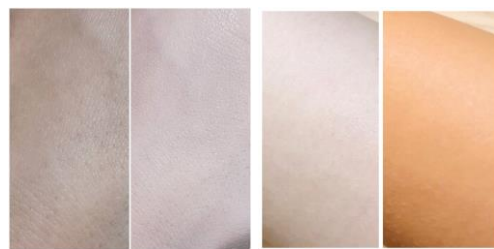
ボディファンデーション ホワイト 使用例

カラーは『ホワイト』と『ブラウン』の2色をラインナップ。韓国人のような透明肌になりたいときは“ホワイトカラー”。健康的な日焼けしたお肌を演出したいときは“ブラウンカラー”を使うなど、用途に合わせてお使い頂けます！