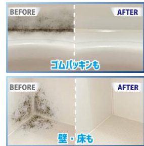
※イメージ 効果を保証するものではありません

また、カビやヌメリはもちろん、髪の毛によるパイプつまりも一発解消。かけてシャワーで流すだけでカビ菌や悪臭を元から分解します。強力なのに自然に優しく、使用後は「水・塩・酸素」に自然分解されます。今までのカビ取り剤では満足できなかった方にオススメの〈カビ取り剤最終兵器 ※5〉です。